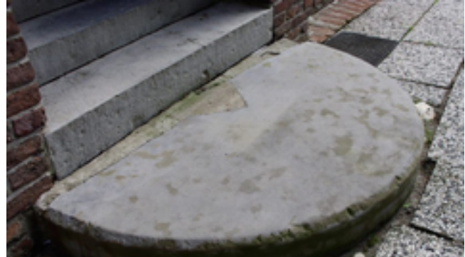
Halber Mühlstein mit quadratischem Auge und Fasse liegt 750m entfernt von der „Moulin de Bracht“ in Boerholz.

Am 05.07.2012 berichteten die Grenzland-Nachrichten 19 über das Ansinnen, die „Moulin de Bracht“ zu lokalisieren, um eventuelle Fundstücke im Erdreich vor einer baulichen Umgestaltung des Einmündungsbereiches Boerholzer Straße/Alster Kirchweg zu sichern. Infolge der Veröffentlichung ergab sich ein Hinweis aus der Bevölkerung dazu, dass es einen erhaltenen Mühlstein der „Moulin de Bracht“ gäbe. Tatsächlich liegt in Boerholz, etwa 750 Meter vom Standort der „Moulin de Bracht“ ein halber Mühlstein von 162 Zentimetern Durchmesser als untere Trittstufe eines Hauseingangs. Nicht nur die geringe räumliche Distanz und das Baujahr des Gebäudes (zwischen 1881 und 1889) lassen einen Zusammenhang mit der „Moulin de Bracht“ vermuten. Ohne um die Existenz der „Moulin de Bracht“ zu wissen, hatte zudem ein Hausbewohner berichtet, dass der Stein von einer Mühle stamme, die auf dem Weg von Boerholz nach Bracht lag.