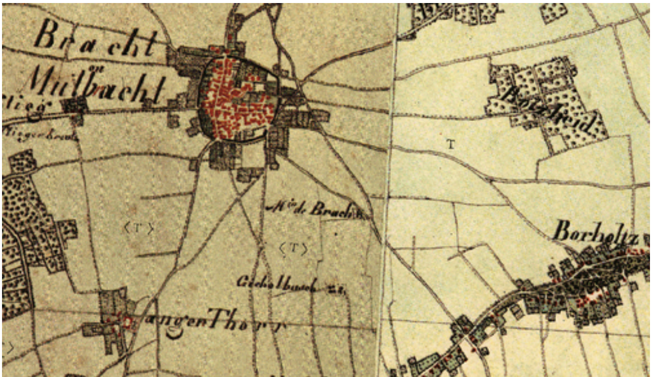
Tranchot-Karte. Die „M[ou]lin de Bracht“ etwa in der Bildmitte.