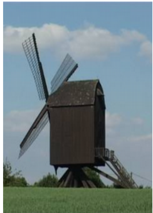
Die Tönisberger Mühle ist vom Bautyp Kasten-Mühle bzw. Bockwindmühle.

Zunächst ist von einer „Kasten-Windmühle“ die Rede, also im Vergleich zur aus Ziegeln gemauerten neuen Brachter Mühle im Turmholländer-Stil ein Gebäude, das ganz oder überwiegend aus Holz gebaut war. Vergleichbare Kasten- oder auch Bockwindmühlen befinden sich im näheren Umfeld in Kempen-Tönisberg (Tönisberger Mühle, 16. Jhd.) und mit ummauerten Bockgestell die „Narrenmühle“ genannte Holtzsche Kornwindmühle von 1809 in Viersen-Dülken. Da Baustil und Ausgestaltung von Windmühlen ähnlichen Baujahres jedoch keine Aussage über den Typ einer Mühle in erreichbarer Nachbarschaft zulassen, kann einzig Oude Hengels Definition der „Moulin de Bracht“ als eine Kasten-Mühle als sicher gelten und dennoch nur vage Schlüsse über ihr tatsächliches Aussehen zulassen. Insbesondere muss vor Fund weiterer Unterlagen offen bleiben, ob die „Moulin de Bracht“ Bestandteile oder gar Nebengebäude aus Stein bzw. Ziegeln besaß.